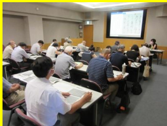
令和2年度の講座風景