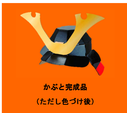
かぶと完成品 (ただし色づけ後)